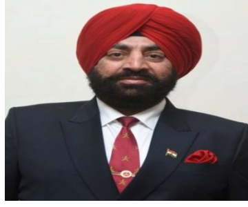
लेफ्टिनेंट जनरल (सेनि,) गुरमीत सिंह मा. राज्यपाल: